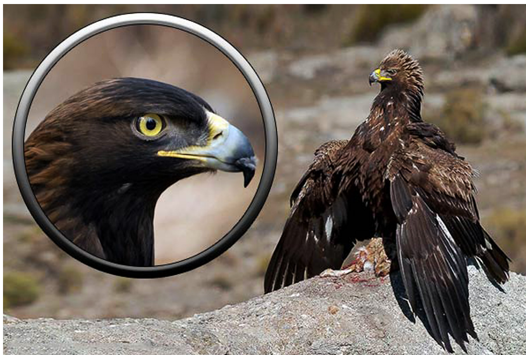
Рис. 3: Беркут (по: [Мир птиц...])

назад головой в пределах контура туловища, профильное с прямо поставленной головой, птица в состоянии полета/парящая (в том числе как элемент композиции), сильно стилизованное изображение птицы, профильное. Можно сказать, что профильные изображения – однозначно хищные птицы. Зубчатые края аппликаций, рельефные выступы по краям пластин, обойм, очевидно, передают оперенье птиц в определенном состоянии (рис. 3).