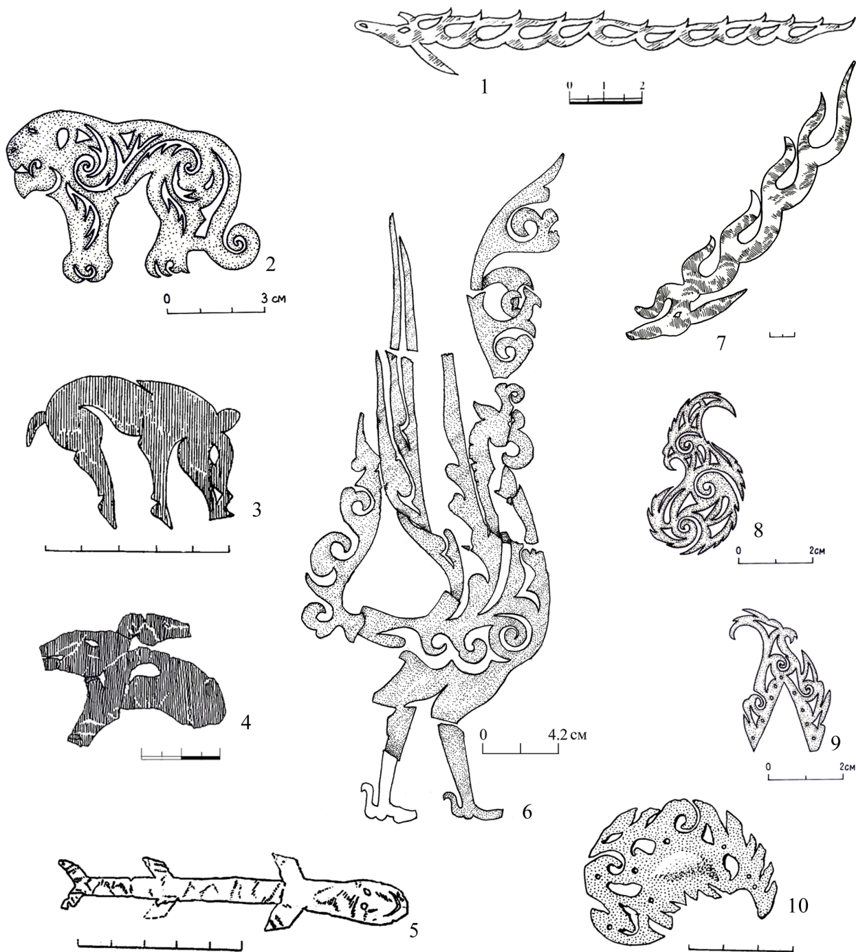
Рис. 2. Зооморфные изображения из памятников сакского времени Казахстана. 1 – Елеке сазы, к. №4; 2 – Карашоки, к. №1; 3 – Шиликты, к. №5; 4, 7 – Талды-2, к. №5; 5 – Шиликты, к. №7; 6 – курган Тасарык; 8, 9 – Шерубай, к. №1; 10 – Южный Тагискен, к. №57

Fig. 2. Zoomorphic images from the archaeological monuments of the Saka time on the territory of Kazakhstan. 1 – Eleke Sazy, mound 4; 2 – Karashoky, mound 1; 3 – Shilikty, mound 5; 4, 7 – Taldy-2, mound 5; 5 – Shilikty, mound 7; 6 – Tasaryk burial mound; 8, 9 – Sherybay, mound 1; 10 – Southern Tagisken, mound 57